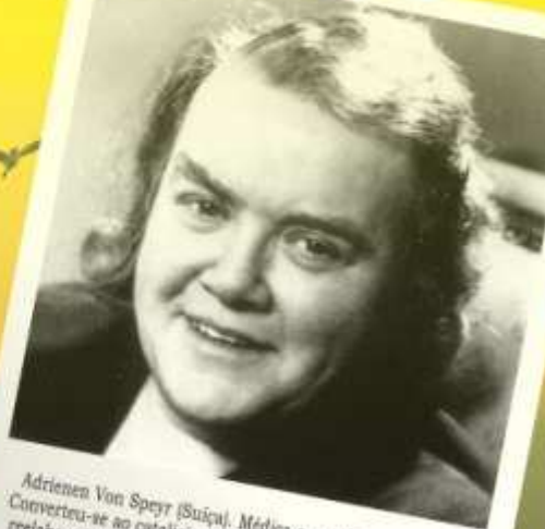
Adrienne Von Speyr (Suíça). Médica e escritora mística. Converteu-se ao catolicismo e recebeu revelações místicas recriadas pelo escritor e maior teólogo do século XX, Hans Urs Von Baltasar.