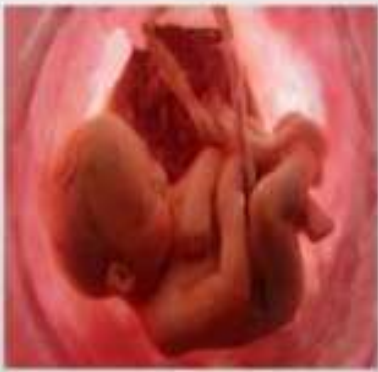
Aborto seletivo de criança do sexo feminino. A China está em primeiro lugar nesse triste primado.