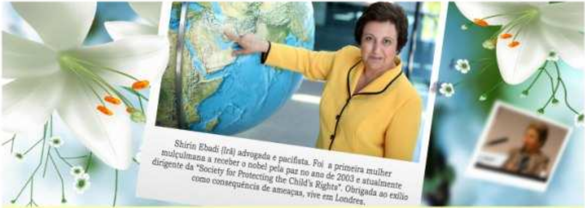
Shirin Ebadi (Irã) advogada e pacifista. Foi a primeira mulher muçulmana a receber o nobel pela paz no ano de 2003 e atualmente dirigente da "Society for Protecting the Child's Rights". Obrigada ao exílio como consequência de ameaça, vive em Londres.