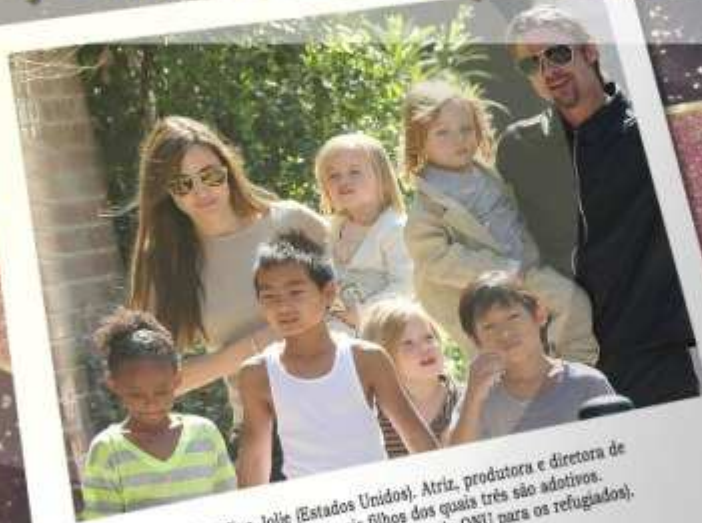
Angelina Jolie (Estados Unidos). Atriz, produtora e diretora de cinema. Mãe de seis filhos dos quais três são adotivos. Embaixadora da UNHCR (Agência da ONU para os refugiados).