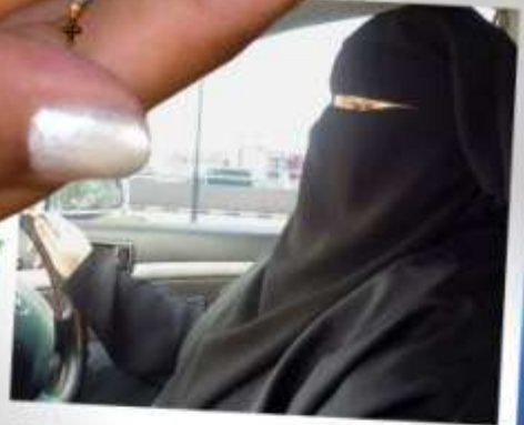
Wajeha al-Huwaider (Arábia Saudita) ativista pelos direitos da mulher no seu país. Conhecida como aquela que no ano de 2008 se fez fotografar dirigindo um carro. Foi presa pela luta em prol dos direitos das mulheres.