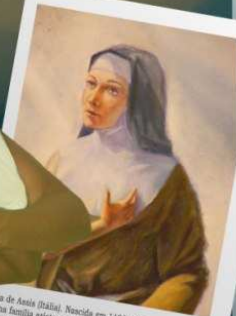
Clara de Assis (Itália). Nascida em 1193, Clara pertencia a uma família aristocrática e rica. Renunciou à ovelha adotando a forma de vida que Francisco de Assis propunha. Amiga do inspirador de um entre os maiores movimentos espirituais de todos os tempos.