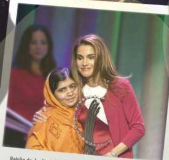
Rainha da Jordânia, Rania al-Yasin (Cisjordânia), filha de pais palestinos, casou com o príncipe Abdullah II da Jordânia. Desenvolve o trabalho em prol de muitas organizações filantrópicas entre as quais a UNICEF (Fundo das nações unidas para crianças).