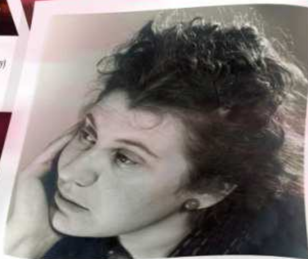
Etty Hillesum (Holanda); escritora hebreia. Durante a segunda guerra mundial tem a oportunidade de fugir para outro país, mas ela renuncia e acompanha os deportados nos campos de concentração nazistas até a última consequência. Morre em Auschwitz no ano de 1943.