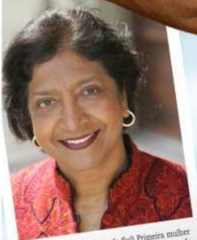
Navanethem Pillay (África do Sul) Primeira mulher não branca a atuar na suprema corte da África do Sul. Juíza e presidente do tribunal penal internacional pelos crimes em Ruanda e alta comissária pelo direitos humanos da ONU (Organização das Nações Unidas).