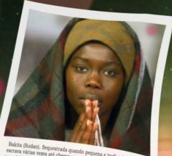
Bakita (Sudan). Sequestrada quando pequena e traficada como escrava várias vezes até chegar a um consul italiano que a levou para Itália e ali fará a sua escolha de se tornar irmã carosiana.