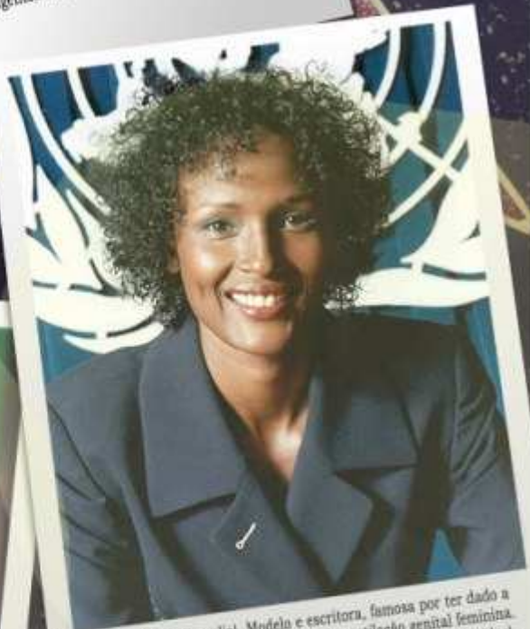
Warris Dirie (Somalia). Modelo e escritora, famosa por ter dado a conhecer ao mundo a problemática da mutilação genital feminina. Agora está trabalhando na ONU (Organização das Nações Unidas) como principal promotora da erradicação dessa prática.