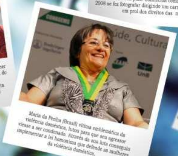
Maria da Penha (Brasil) vítima emblemática da violência doméstica, lutou para que seu agressor viesse a ser condenado. Através da sua luta conseguiu implementar a lei homônima que defende as mulheres da violência doméstica.